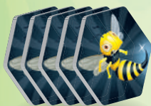
5 жетонов ос