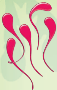
8 липких языков (включая 2 запасных)