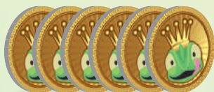
30 жетонов вкусняшек