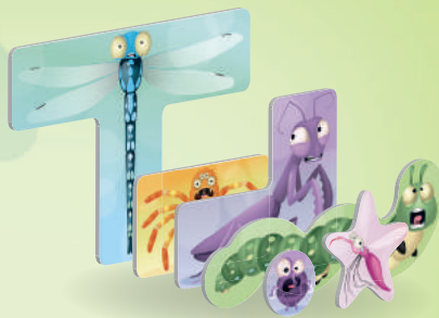
30 жетонов насекомых (по шесть пяти цветов)